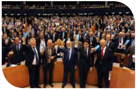
Los líderes y alcaldes de la UE respaldan de forma simbólica el Pacto de las Alcaldías para el Clima y la Energía en el Parlamento Europeo en 2015

Se comprometen a preparar Planes de Acción para la Energía Sostenible y el Clima para el año 2030 e implantar actividades locales de atenuación y adaptación al cambio climático .